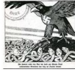
آلمان نازیستلری یهودلاری سمی ایلانلارا بئزئمک ایسنه بیر دبلر. اونلارا گۆره بو ایلانلار آلمان اینسانینا ضرر بئتیرمه دن آلمان اس اس گوجلری بیر فارنال کیمی بو ایلانلاری بوخ ائتمه لی ایمیش