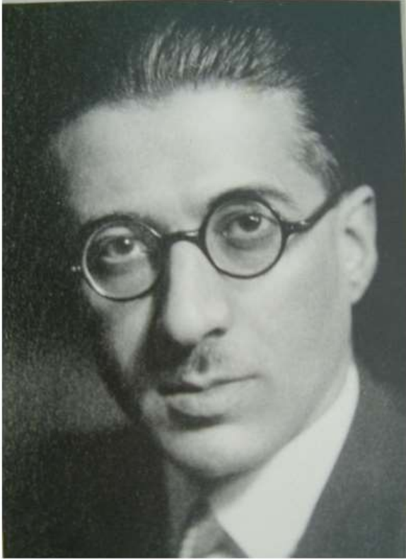
ابولقاسم نجم، نازیست آلمانداکی ایران سفیری

آلمان نازیست علوم وزیری نین وزیر معاونی Vahlen آلمانلیلارین و ایرانلیلارین آریا عیرقیندان، هیندوگئرمین عیرقینا باغلی اولدوقلارین