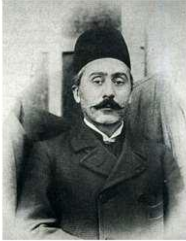
ميرزه يوسف خان

ميرزه فتحعلى آخوندزاده و ميرزه يوسفخان مستشار الدوله تبريزلى و فارس حاكميتينه گئدن يول، ائله جه ده غريده "فارسىستان" آدى يئرینه "ايران" آدى نين تانيديلماسى!