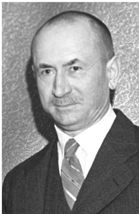
Wipert von Blücher

کئچمه سی، مملکتده فارسچا دانشیديغيميز و يازيشديغيميز کيمي، خاريجی دانشيق و يازيشمالاريميزدا دا ايران و ايرانيان يازماميز لازيم گورونر. بو تکليف ايله خاريجه ايشلر ناضرليگی راضي اولدوغو اوچون، خاريجه ناضرليگی نين بو مسئله نی تأييد ائتمه سی ايله عالی مقاملار دا بونو تأييد ائتميش. 1314-ونجو ايلين فروردين آبی نين بيريندن بو دستور العمل يئرینه يئتيريلمه ليدير" 174 .