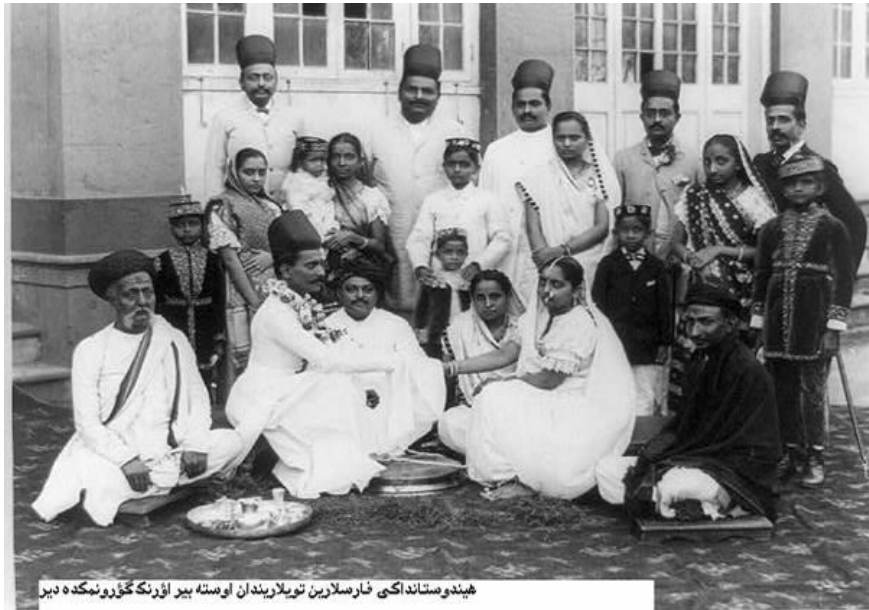
هیندوستانداکی فارسلا رین تویلا ریندن اوسته بیر اؤرنک گؤرونمکه ده دیر

فیروزه قاندى، ایندیرا قاندى نین اری و راجیو قاندى نین آتاسی دا زردوشت مذهب بیر فارس ایمیش. آشاعیداکی شکل هیندوستاندا زردوشت مذهب بیر فارس عائله-دن، بیر تویدا چکیلمیشدیر: